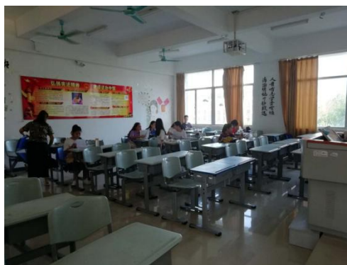
周三，阳光下的校园晨读之一 2-206（16 旅本 1，陈芳）英语晨读，人数有 29 人。