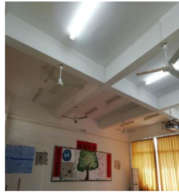
周一，第 9、10 节，1-409（形势与政策，唐图，17 报关 1，17 国经 1，2 班）教室无人上课，投影仪开着。