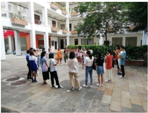
周三，阳光下的校园晨读之四 1 号教学楼下的英语晨读，18 会计 6 班等，人数有 40 人。