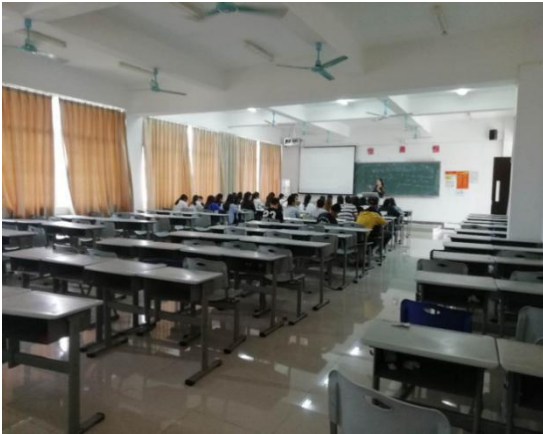
周四，第 5、6 节，2-322，（王林，统计基础，17 光明会计）老师认真授课，学生抬头率 100%。