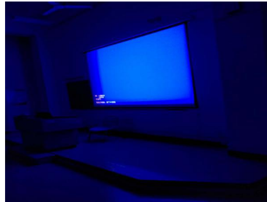
周一，第 5、6 节，1-503（营销创意与策划，16 营销 3，黄琳）投影仪没关。