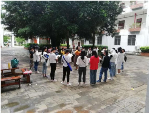
周四，雨后的校园晨读之四