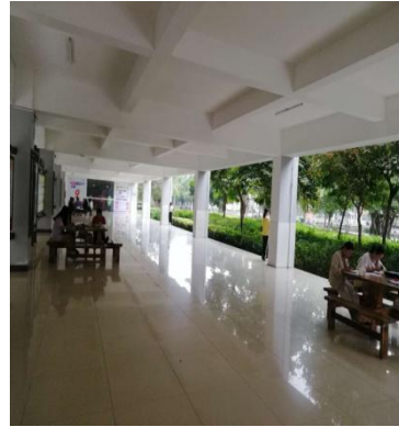
周四，雨后的校园晨读之六

截止 8 点，2 号教学楼 524（18 会计 3）；522（18 会计 5）；521（16 金融 4+0）；605（17 旅本 2）等各教室晨读人数有 128 人。