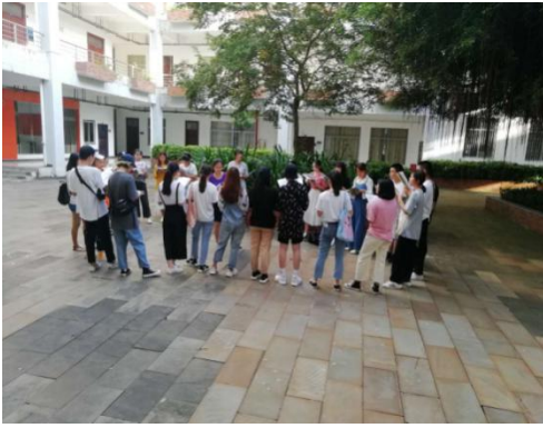
周二，阳光下的校园晨读之五