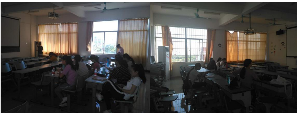
周三，阳光下的校园（教室）晨读之三