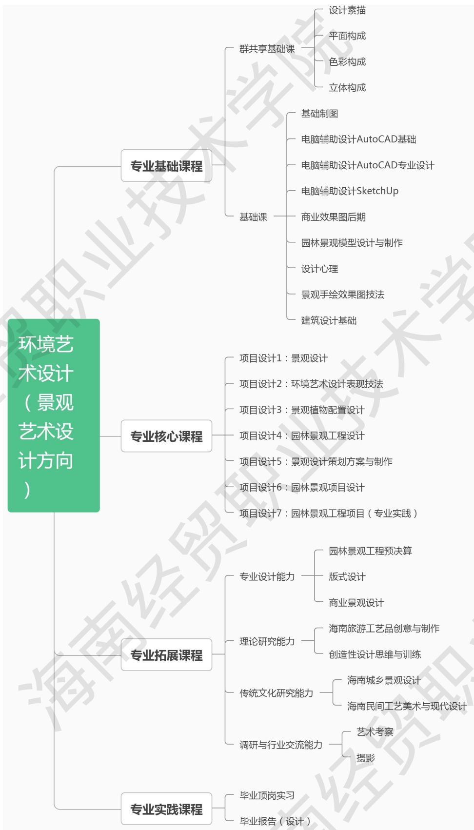
图 7 环境艺术设计（景观设计方向）专业课程结构图