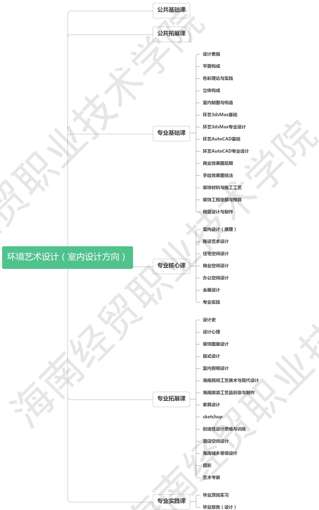
图 6 环境艺术设计（室内设计方向）专业课程结构图