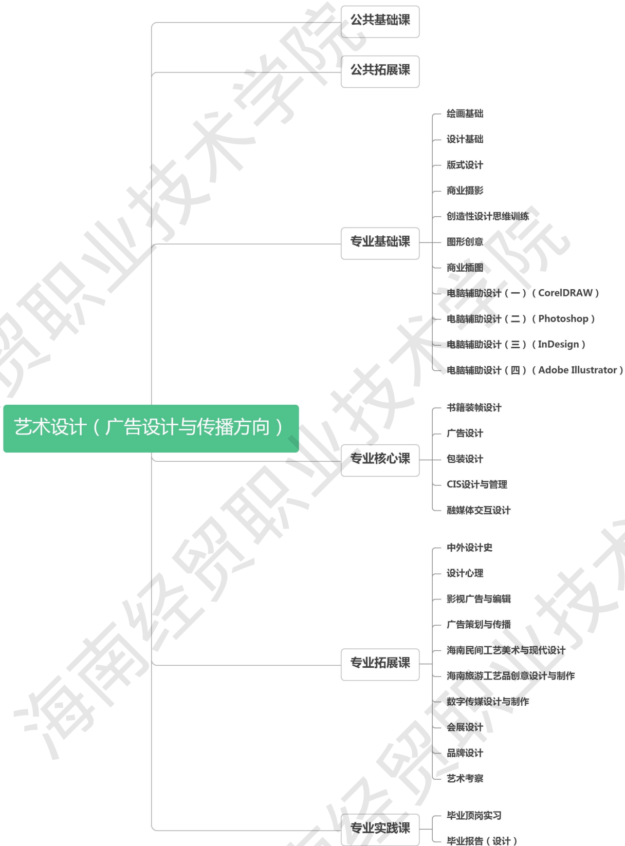
图 4 艺术设计（广告设计与传播方向）专业课程结构图