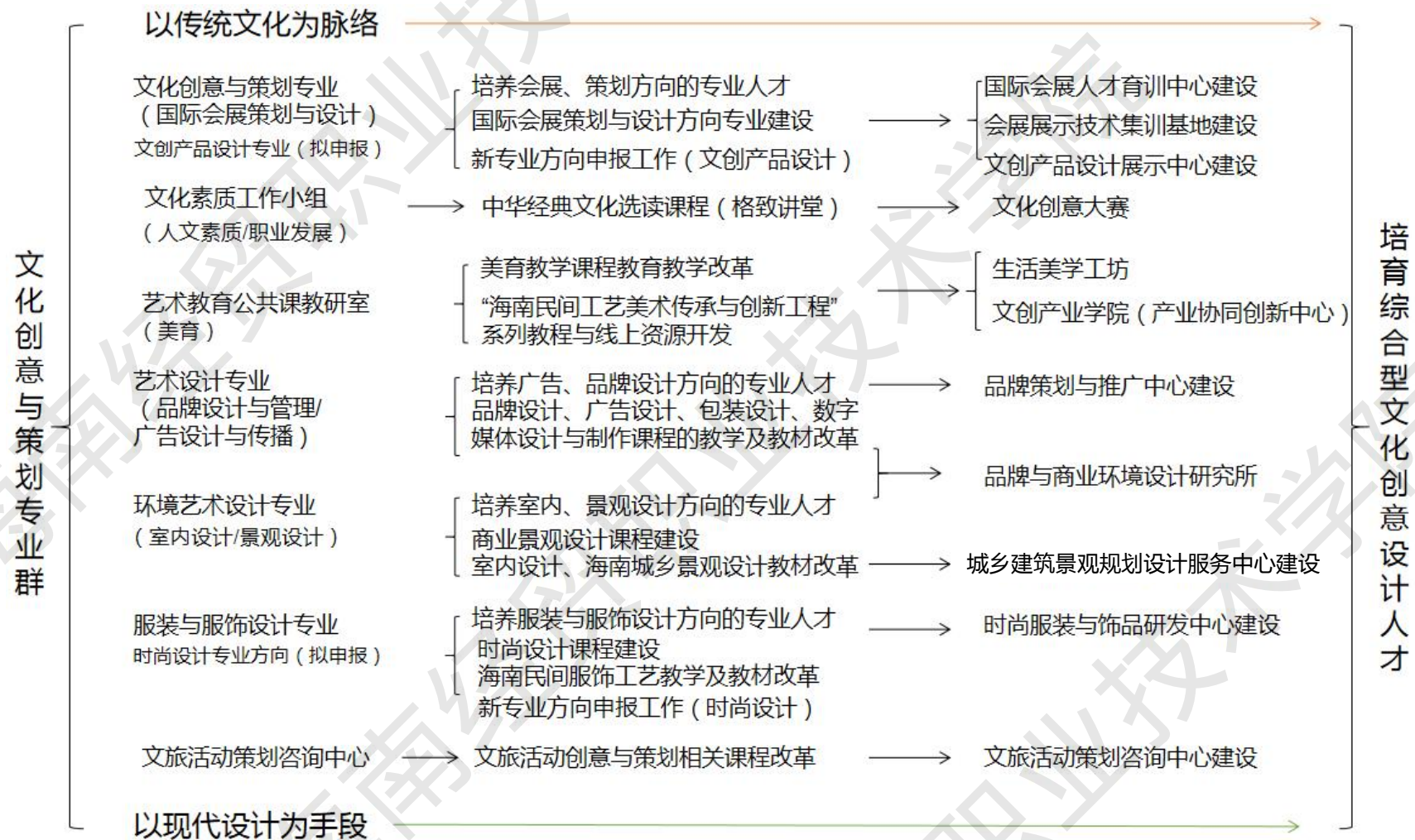
图1 专业群建设思路