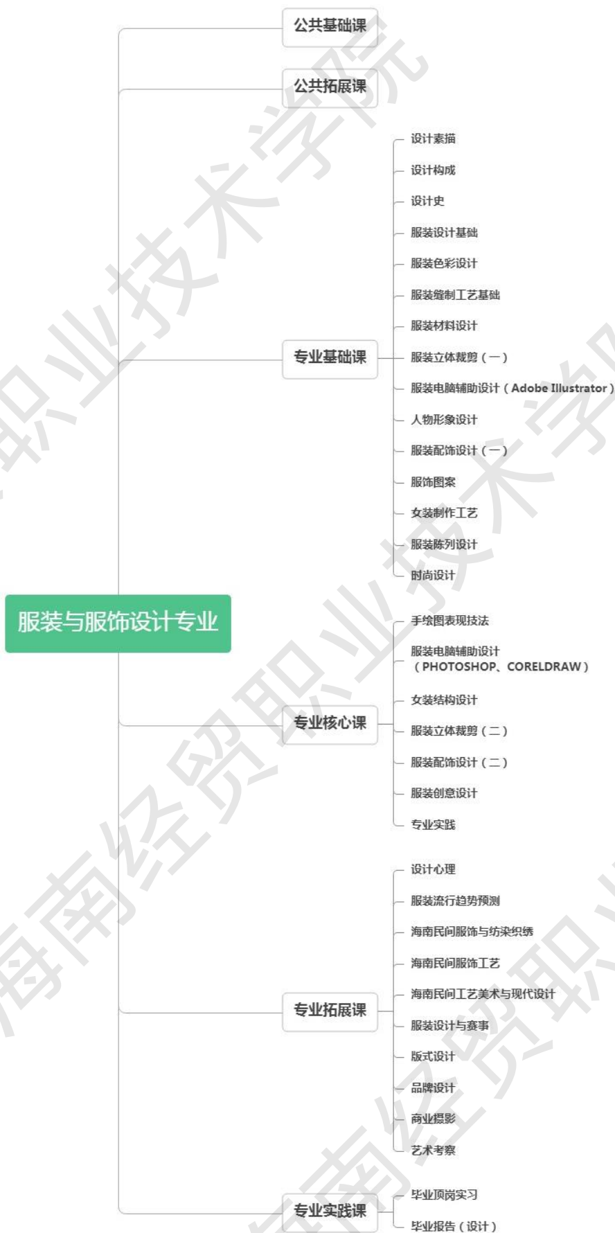
图 8 服装与服饰设计专业课程结构图