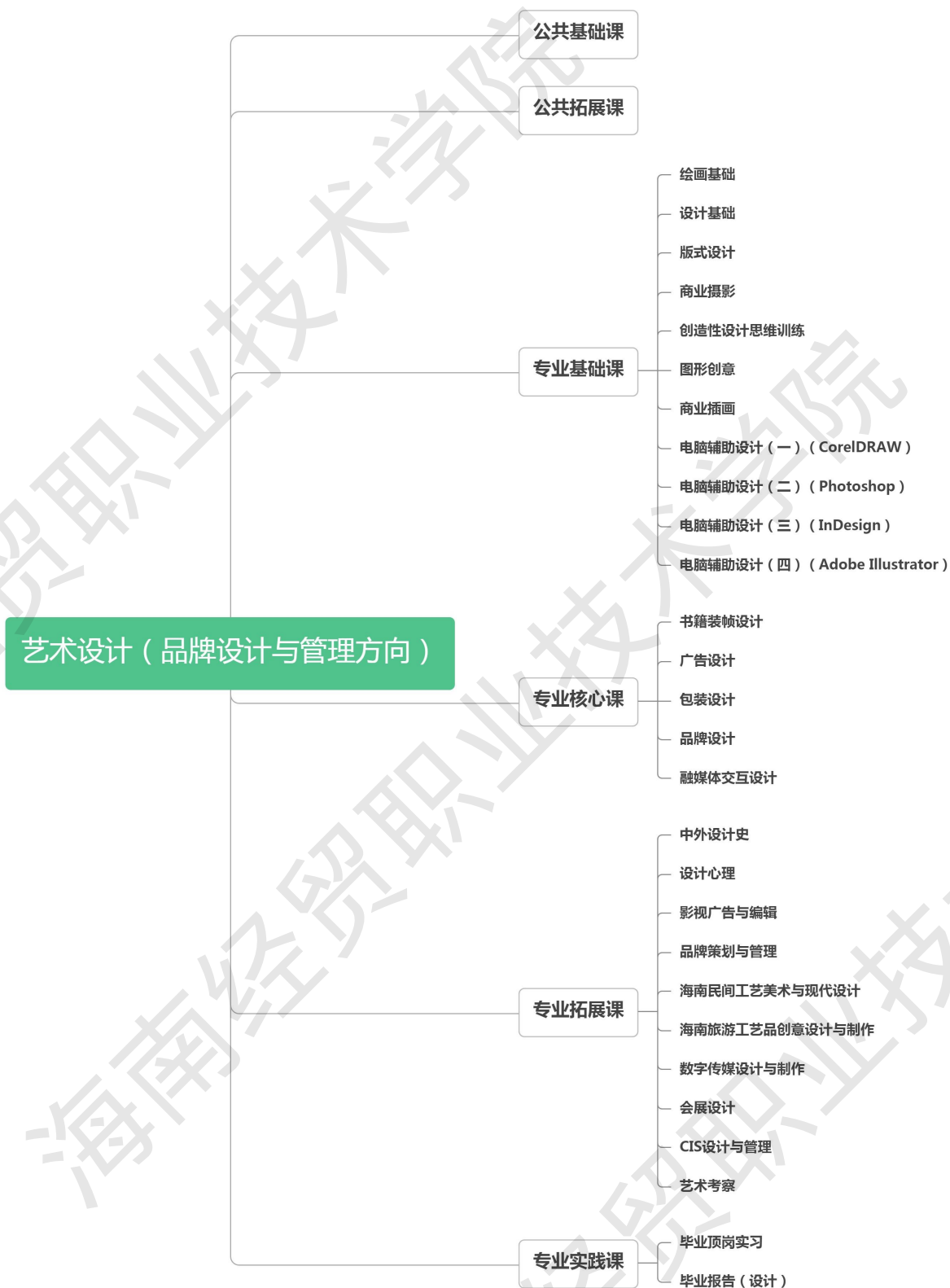
图 5 艺术设计（品牌设计与管理方向）专业课程结构图