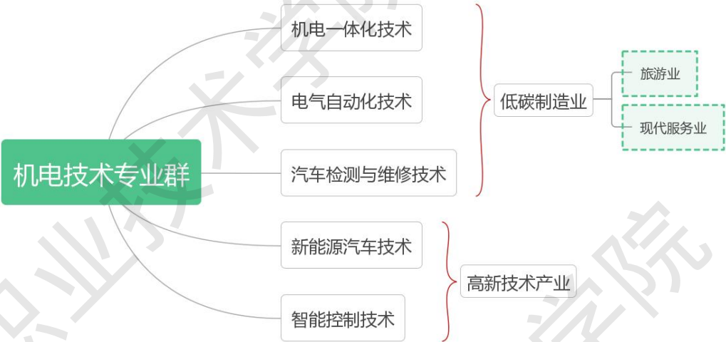
图 1 机电技术专业群组群逻辑图