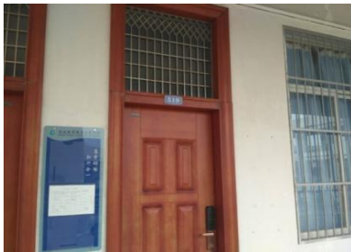
周五，第 7、8 节，1-519（设计心理，徐浩，17 室内设计 2）学生做作业，老师看手机。