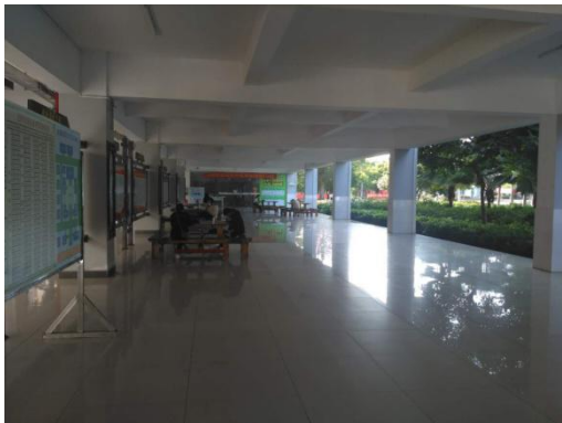
周二，一号教学楼下晨读 20 人。