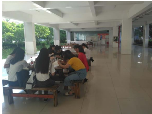
周四，阳光下的校园（教室）晨读 17 周了，17 日语班还在坚持集体晨读，20 人。