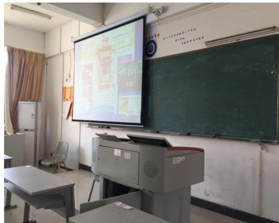
周四，第 1、2 节，1-413（市场营销基础，17 连锁，贺亚茹）课表有课，无人上课，教室投影仪也没关。