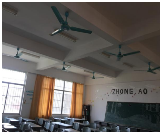
周五，第3、4节，2-422 17 会计 3+2 高职 下午无课，至4点35分，一台空调开着。