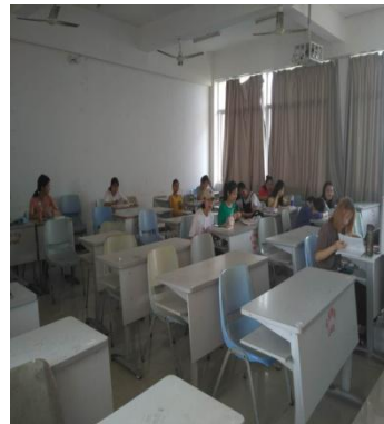
周二，阳光下的校园（教室）晨读之三 截止8点，2号教学楼，521（17金融4+0）；420（16统计4）；324（17财管3）；305（16审计1）；205（16旅管3）等各教室晨读人数有89人。