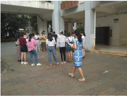
周一，阳光下的校园（教室）晨读之六 截止8点，1号教学楼，602（17商英2）；404（17营销3+2）等各教室晨读人数有82人。