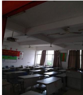
周二，第 3、4 节，2-208 17 旅管 2 下午 4 点 20 分，2-208 教室无人上课，但 2 台空调开着。