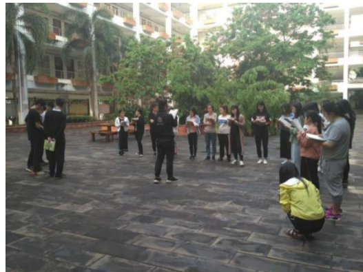
周四，雨后校园的晨读之三