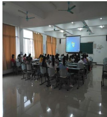
周四，雨后的晨读之一